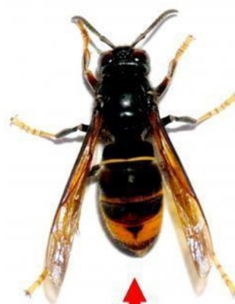
Frelon asiatique (taille réelle 3 cm)