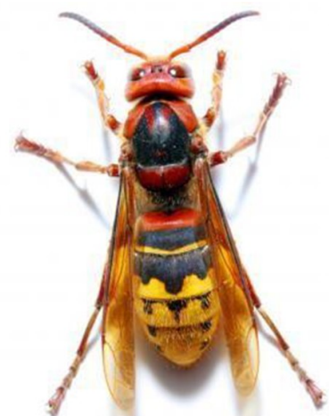
Frelon commun (jusqu'à 4 cm)